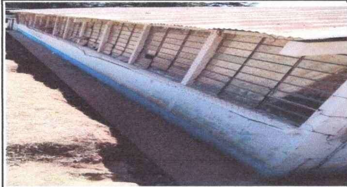
Foto1: Sustitución de Vidrios quebrados y balcones