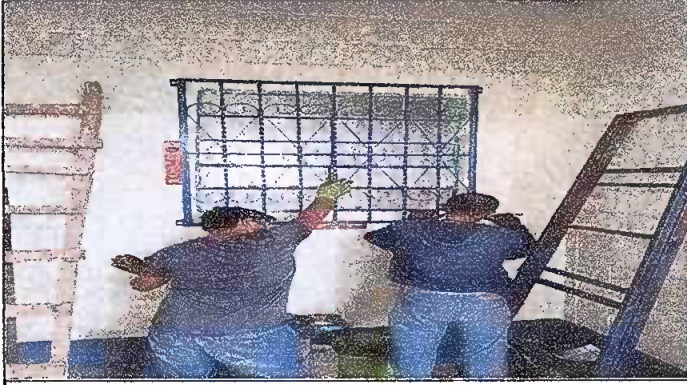
MODULO 2: Foto 7 Sustitucion de balcones de metal.