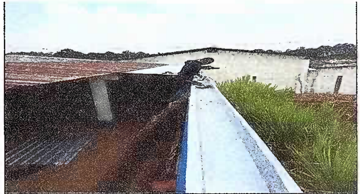
MODULO 3: Foto 10 Sustitución de canal.