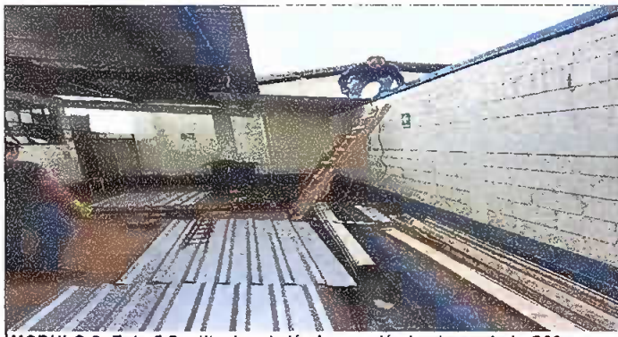
MODULO 2: Foto 5 Sustitucion de lámina por lámina troquelada C26