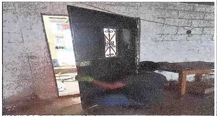
MODULO 2: Foto 6 Sustitucion de chapas.

Observación: Si es necesario se pueden agregar hojas adicionales y actualizar el número de hojas.