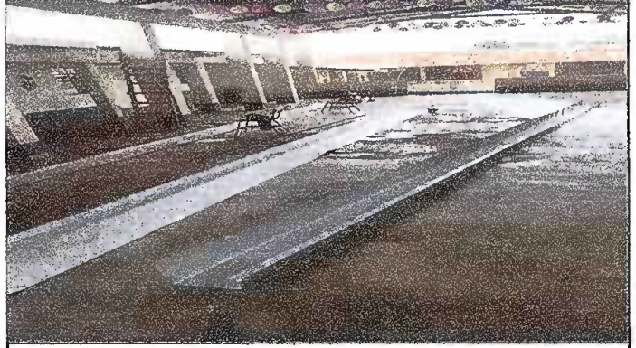
MODULO 2: Foto 8 Sustitucion de canal.