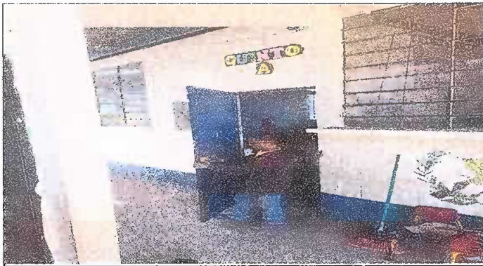
MODULO 3: Foto 9 Sustitución de chapas.