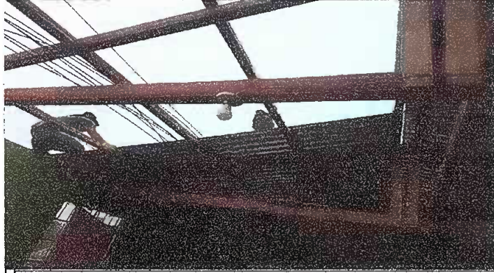
MODULO 1: Foto 1 Sustitucion de lamina y sustitucion de estructura de madera por metal.