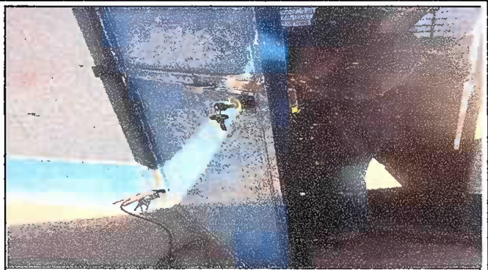
MODULO 1: Foto 2 Sustitucion de chapas.