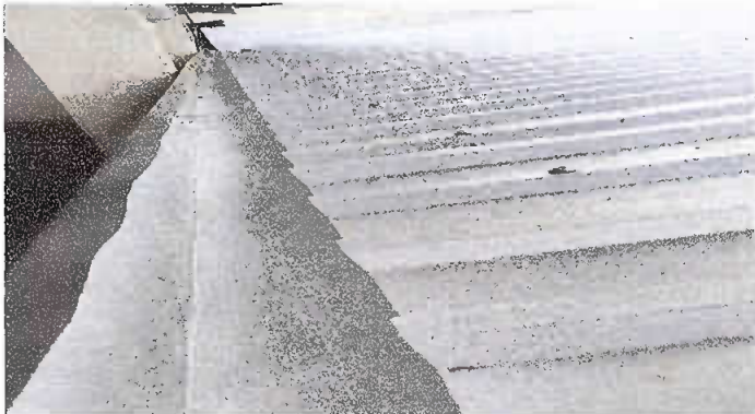
MODULO 1: Foto 3 Sustitución de canal de metal y sustitucion de pescante de metal