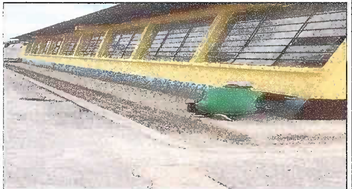
Foto 4 Pintura general.