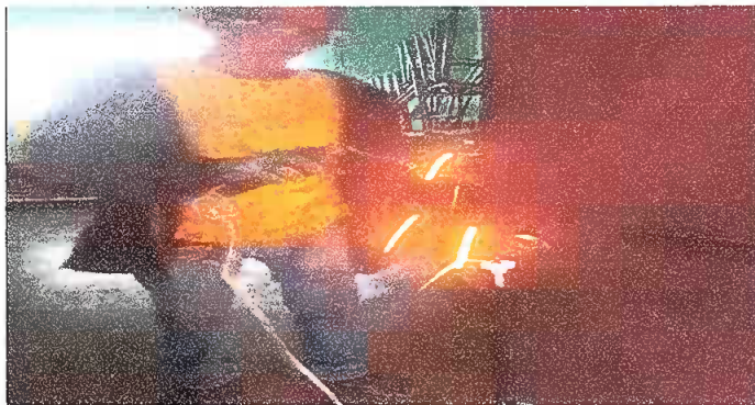
MODULO 4: Foto 11 Sustitución de chapa.