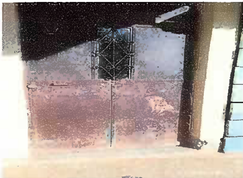
Foto 5: Mantenimiento Pintura de puertas de aulas. Módulo 1, 2 y 3.