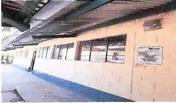
Foto 1: Suministro e instalación de balcones de metal. Módulo 1, 2 y 3