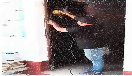
Módulo 1. Mantenimiento a estructura (lijado, cepillado y aplicación de pintura)