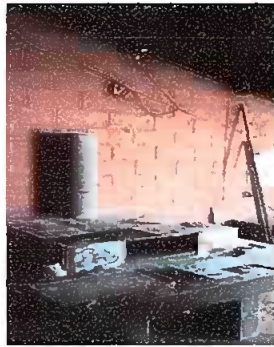
Módulo 1. Sustitución de estufa rural (completa)