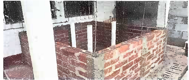
Módulo 1. Sustitución de pila