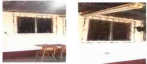
Módulo 2. Sustitución de vidrios

Observación: Si es necesario se pueden agregar hpgs adicionales y actualizar el número de hojas.