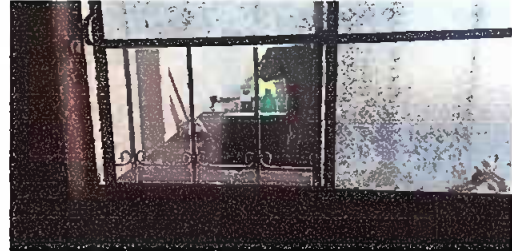
Módulo 1. Sustitución de vidrio