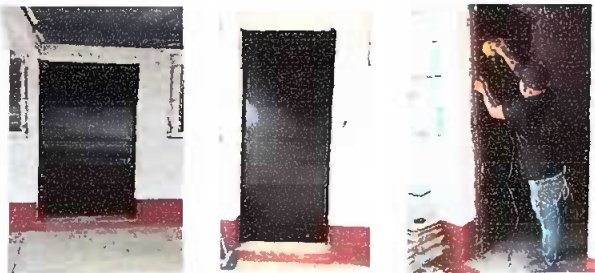
Módulo 2. Mantenimiento a estructura (lijado, cepillado y aplicación de pintura), Sustitución de chapa y sustitución de vidrios