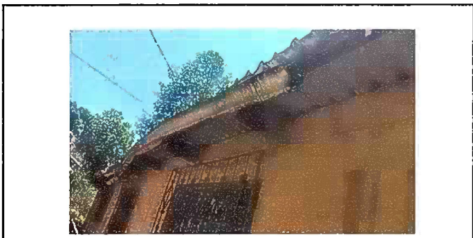
foto 5 sustitucion de Canal PVC