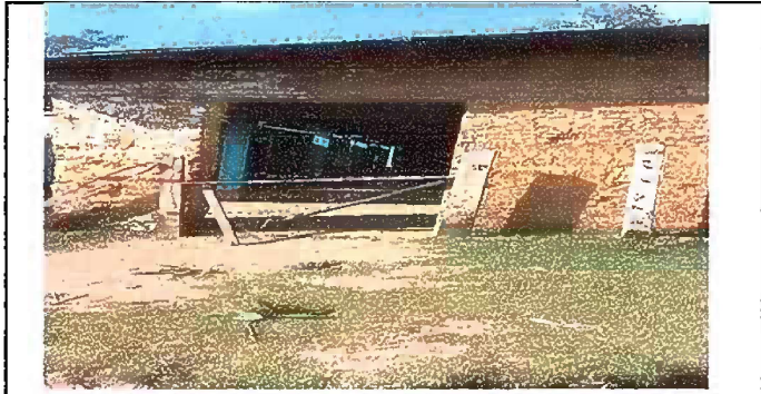
Foto1: sustitucion de puerta de maya por porton de metal (sobre las columnas)