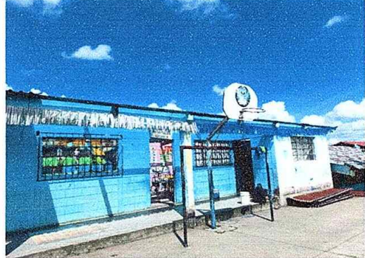
Foto 2: Sustitución de lámina, por lámina troquelada aluzinc calibre 26, módulo No. 2