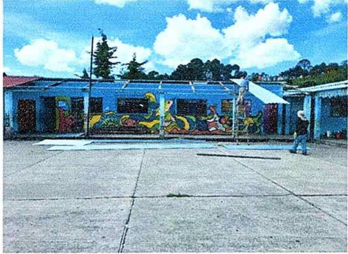
Foto1: Sustitución de lámina, por lámina troquelada aluzinc calibre 26, módulo No. 1