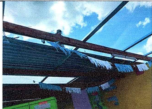
Foto 10: Sustitución de estructura de soporte de madera por metal, módulo No. 1

Observación: Si es necesario se pueden agregar hojas adicionales y actualizar el número de hojas.