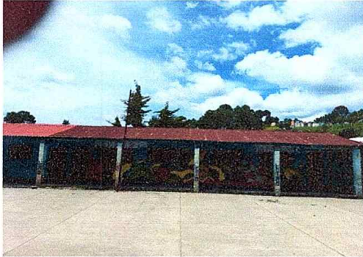
Foto1: Sustitución de lámina, por lámina troquelada aluzinc calibre 26, módulo No. 1