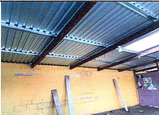
Foto 9: Sustitución de estructura de soporte de madera por metal, módulo No. 1