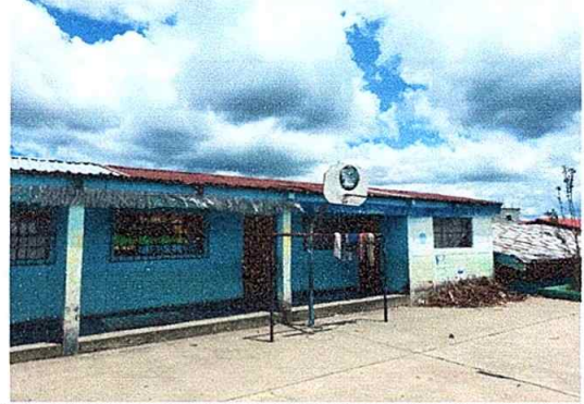
Foto 2: Sustitución de lámina, por lámina troquelada aluzinc calibre 26, módulo No. 2