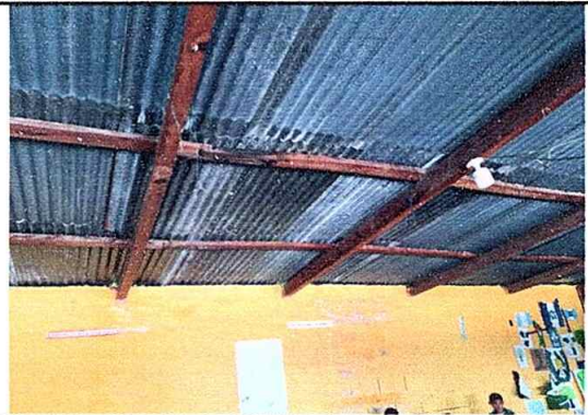
Foto 10: Sustitución de estructura de soporte de madera por metal, módulo No. 1