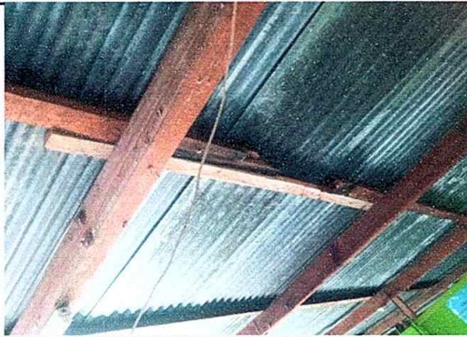
Foto 9: Sustitución de estructura de soporte de madera por metal, módulo No. 1