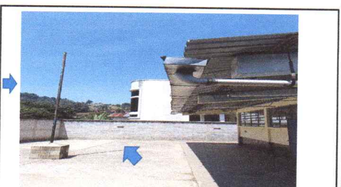
Suministro e instalación de ventanería Suministro e instalación Canal Metalico

Observación: Si es necesario se pueden agregar hojas adicionales y actualizar el número de hojas.