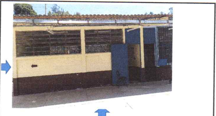
Suministro e instalación Lamina 45m2 Lamina troquelada MaxAlum C28(0.30mm) Suministro e instalación de puerta 2.20 x 1 mt con 6 Cuadros con chapa Yale