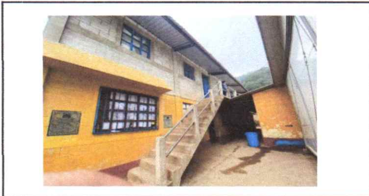
Aplicación de pintura por fuera de aulas