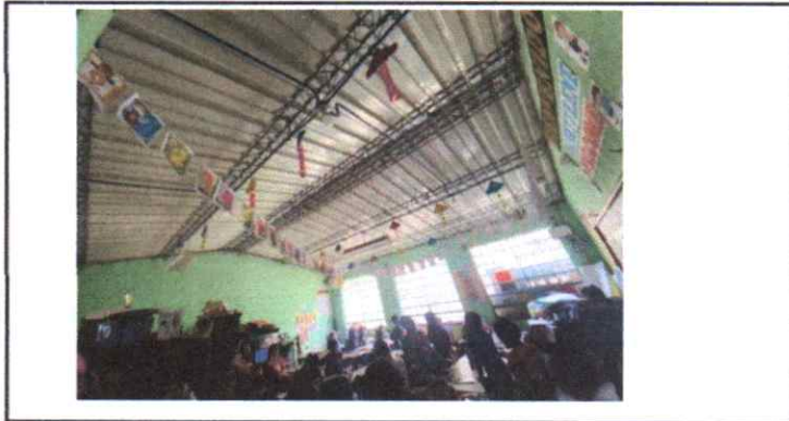
Sustitución de lámina, por lámina troquelada Calibre 26 de 0.40