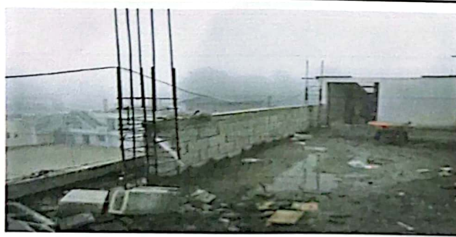
Foto3: Colocación del primer tramo de muro.