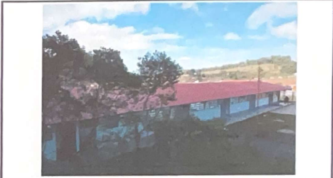
Foto 2: REPARACIÓN/SUSTITUCIÓN MANTENIMIENTO DE CUBIERTA DE LÁMINA. De lámina por la lámina troquelada calibre 26.