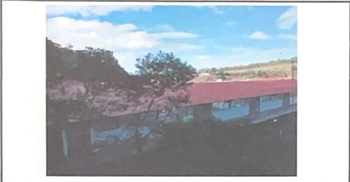
Foto 1: REPARACIÓN/SUSTITUCIÓN MANTENIMIENTO DE CUBIERTA DE LÁMINA. De lámina por la lámina troquelada calibre 26.