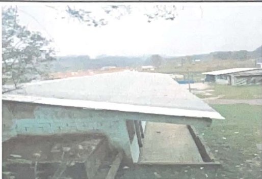
Foto 3: REPARACIÓN/SUSTITUCIÓN MANTENIMIENTO DE CUBIERTA DE LÁMINA. De lamina por lámina troquelada calibre 26