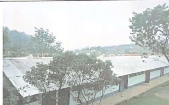
Foto 2: REPARACIÓN/SUSTITUCIÓN MANTENIMIENTO DE CUBIERTA DE LÁMINA. De lamina por lámina troquelada calibre 26