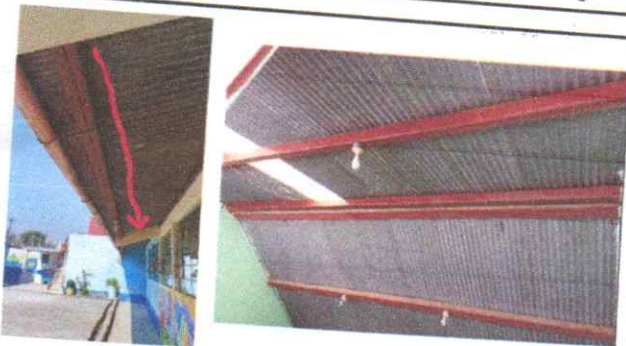
Mantenimiento de estructura portante