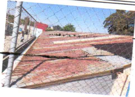
Sustitución de lámina, por lámina troquelada Calibre 26