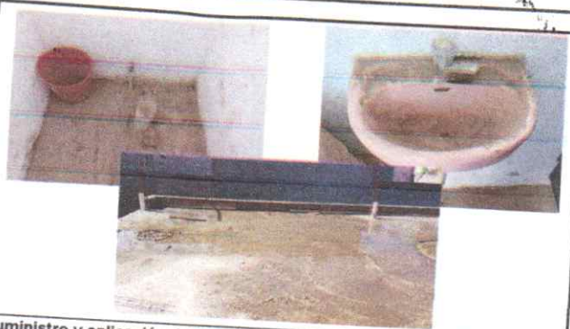
Suministro y aplicación de impermeabilizante en losa

Observación: Si es necesario se pueden agregar hojas adicionales y actualizar el número de hojas.