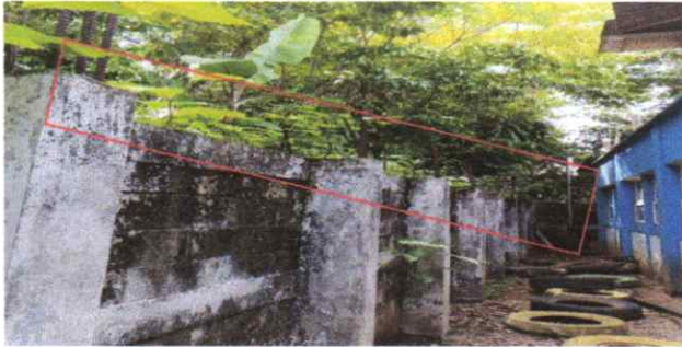
Suministro y Reparación de Muro Perimetral