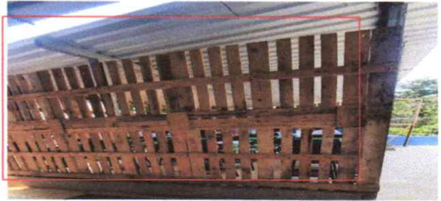
Suministro y Sustitucion de muro de concreto