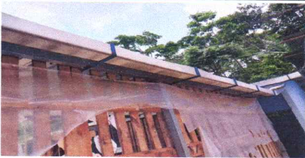
Suministro y Sustitución de bajadas de agua pluvial de tubo de PVC de 3"