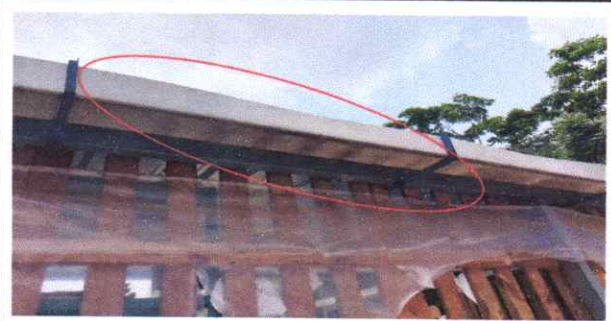
Suministro y Sustitucion de Canales de PVC