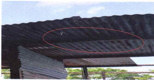
Suministro y Sustitución de Estructura de Madera por estructura de metal