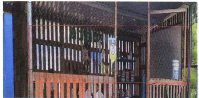
Suministro y Sustitución maya galvanizada por balcones

Observación: Si es necesario se pueden agregar hojas adicionales y actualizar el número de hojas.