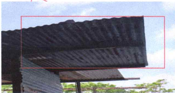
Suministro y Sustitución de lamina zinc por lámina troquelada calibre 26