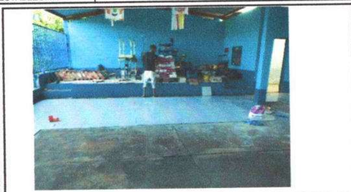
Foto1: SUSTITUCIÓN DE PISO DE CONCRETO POR CERÁMICO