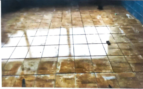
Foto 9: SUSTITUCIÓN DE PISO DE CONCRETO POR PISO CERÁMICO CON BASE DE CONCRETO, módulo 3