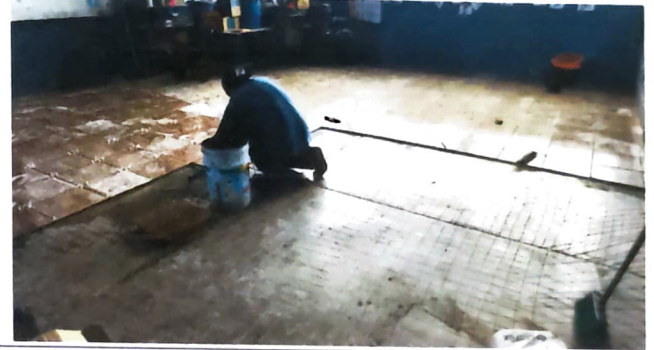
Foto 10: SUSTITUCIÓN DE PISO DE CONCRETO POR PISO CERÁMICO CON BASE DE CONCRETO, módulo 4

Observación: Si es necesario se pueden agregar hojas adicionales y actualizar el número de hojas.