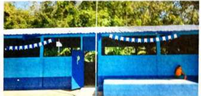
Foto 10: Mantenimiento de estructura de metal en 2 aulas y cambio de tornillos de techo en 4 aulas