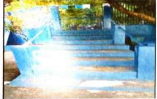
Foto 8: Reparación de gradas de entrada principal