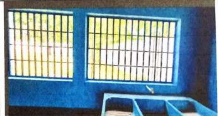
Foto 4: Sustitución de balcones de metal en cocina