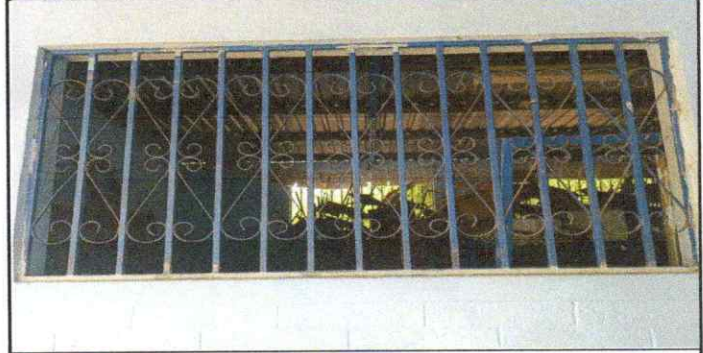
MANTENIMIENTO DE BALCONES DE METAL