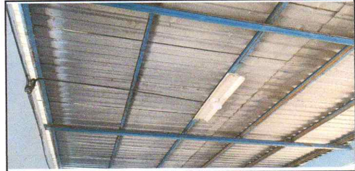
SUSTITUCIÓN DE CUBIERTA DE LÁMINA POR LÁMINA ALUZINC TROQUELADA C 26

Observación: Si es necesario se pueden agregar hojas adicionales y actualizar el número de hojas.