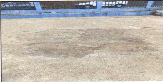
SUSTITUCIÓN DE TORTA DE CONCRETO EN PATIO