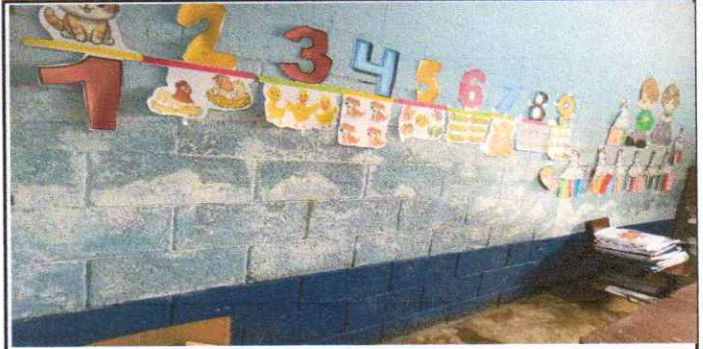
SUMINISTRO Y APLICACIÓN DE PINTURA EN MUROS INTERIOR Y EXTERIOR