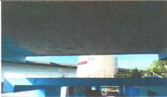
Foto 13: INSTALACION DE DEPÓSITO DE AGUA DE 1100 LITROS CON SUS ACCESORIOS