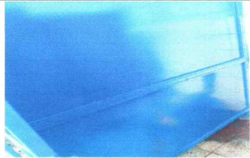
Foto 14: APLICACIÓN DE PINTURA TIPO ANTIFORRO EN PARED DE SANITARIOS