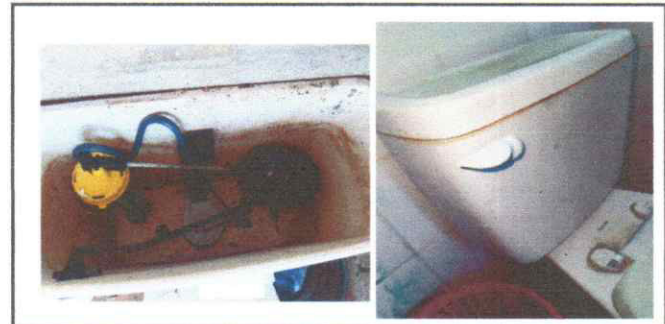
Foto 6: Instalacion de tuberia en servicios de sanitarios, sustitucion de accesorios para sanitarios

Observación: Si es necesario se pueden agregar hojas adicionales y actualizar el número de hojas.