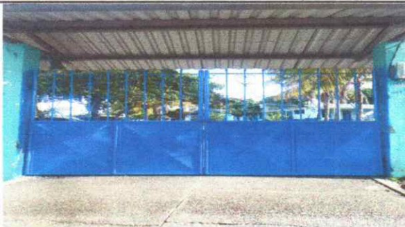
Foto 15: FABRICACION E INSTALACION DE PORTON DE METAL EN ENTRADA PRINCIPAL

Observación: Si es necesario se pueden agregar hojas adicionales y actualizar el número de hojas.