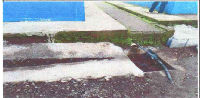
Foto 2: Instalacion de drenaje aguas pluviales con cajas de registro