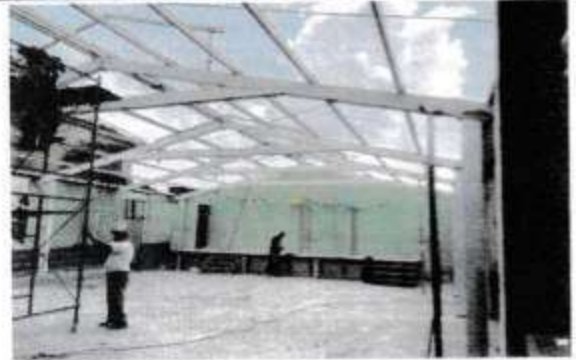
Foto 2: Suministro y sustitucion de lamina por lamina troquelada calibre 26