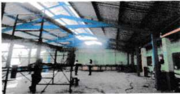
Foto 3: Sustitución de base de estructura para cubierta lamina