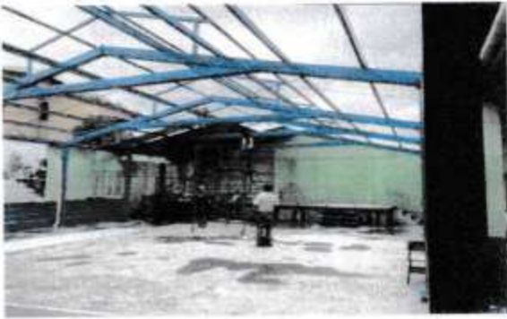
Foto 1: Mantenimiento a estructura de soporte de cubierta de metal