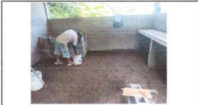
Foto 7: SUSTITUCION DE ESTUFA RURAL CON CHIMENEA Y PLANCHA METAL.