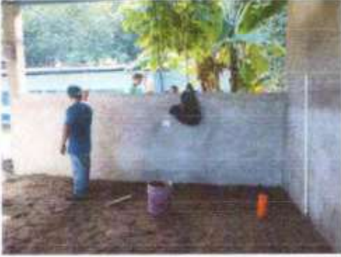
Foto 1: PEPILLO, CERNIDO EN PAREDES DE COCINA, REPARACION DE MUROS.