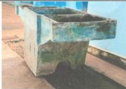
Foto 3: Suministro y sustitución de pila