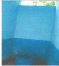
Foto1: Suministro y sustitución de sanitarios