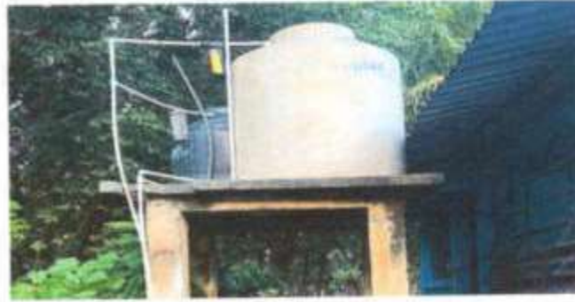
Foto 6: SUSTITUCION DE DEPOSITO DE AGUA DE 1100 LT.

Observación: Si es necesario se pueden agregar hojas adicionales. Número de hojas: 3