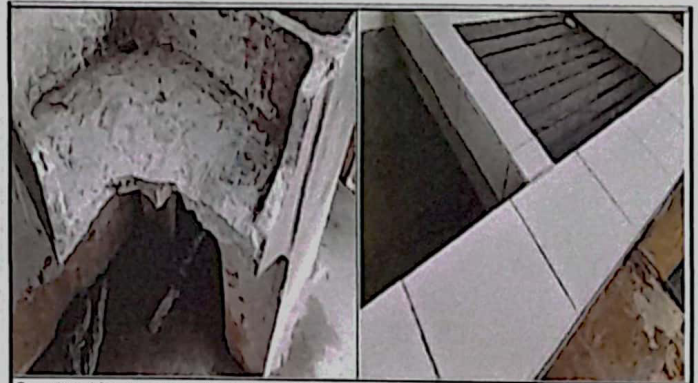
Sustitución de pilas de 3.10*0.90*0.85M de 2 lavaderos + azulejo

Observación: Si es necesario se pueden agregar hojas adicionales y actualizar el número de hojas.