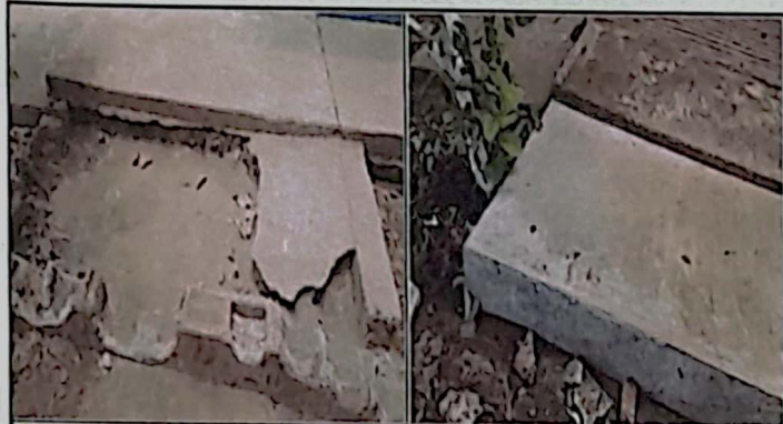
Fundición de encaminamiento área de cocina