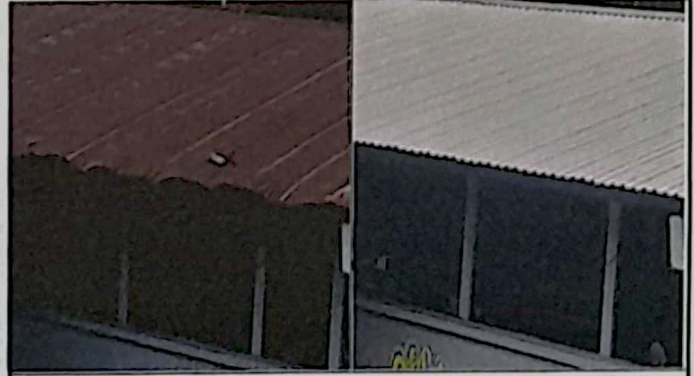
Sustitución de lámina en módulo de 1 aula