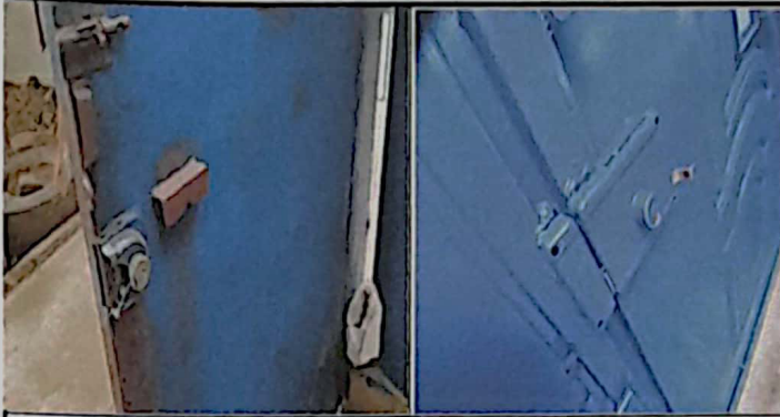
Sustitución de portón de ingreso primario y secundario