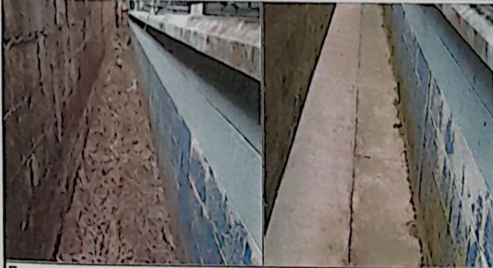
Banqueta de protección módulo 1