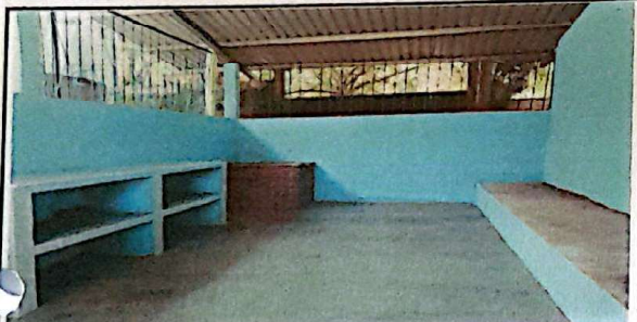
Sustitución de torta de concreto en modulo de cocina