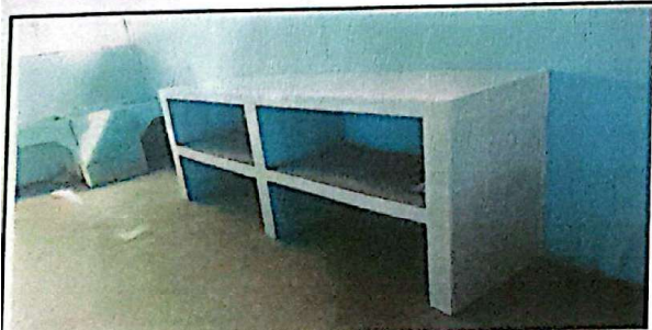
Suministro y reparación de mesa de trabajo en cocina