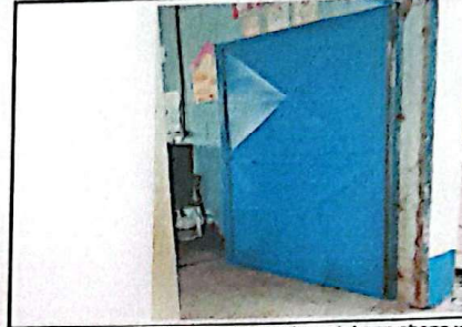
Suministro y sustitución puertas de metal con chapa yale modulo de aulas.