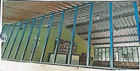
Suministro e instalación de balcones de metal modulo de aulas y cocina