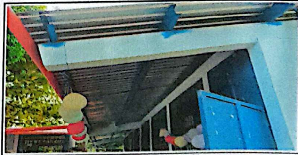
Sustitución de lámina troquelada aluzinc calibre 26

Observación: Si es necesario se pueden agregar hojas adicionales y actualizar el número de hojas.