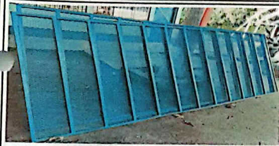
Suministro e instalación de balcones de metal modulo de aulas y cocina