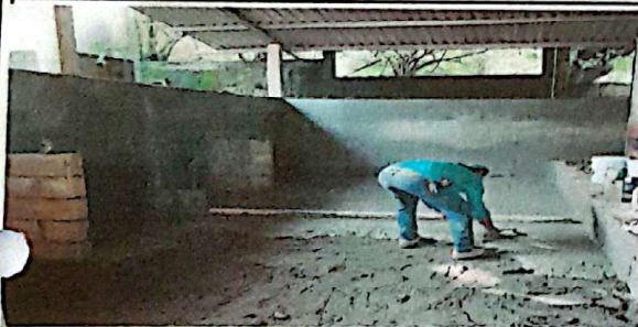
Sustitucion de torta de concreto en modulo de cocina