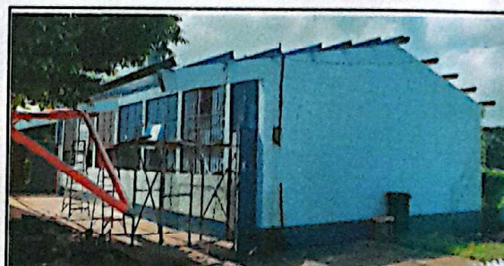
Sustitución de lámina troquelada aluzinc calibre 26

Observación: Si es necesario se pueden agregar hojas adicionales y actualizar el número de hojas.