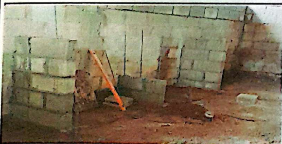
Suministro y reparación de mesa de trabajo en cocina