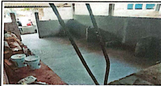
Suministro y reparacion de muros exteriores e interiores en modulo de cocina y aulas.