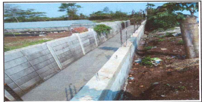
Foto 6: VISTA DE SUSTITUCION DE MURO PERIMETRAL Y CUNETA DE CONCRETO FINALIZADO

Observación: Si es necesario se pueden agregar hojas adicionales y actualizar el número de hojas.