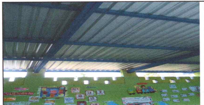
Foto 4: VISTA INTERIOR INSTALACION DE COSTANERAS GALVANIZADAS FINALIZADO