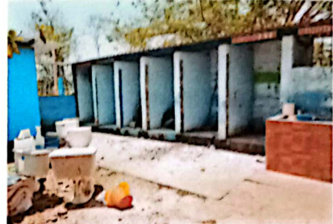
SUSTITUCION DE PUERTAS METALICAS DE SERVICIOS SANITARIOS