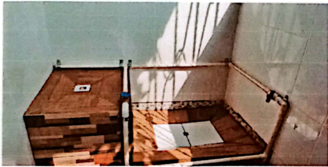
MANTENIMIENTO EN URINALES