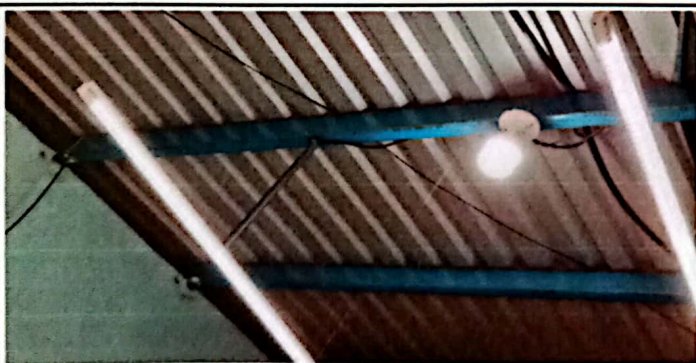
MANTENIMIENTO A SISTEMA ELECTRICO