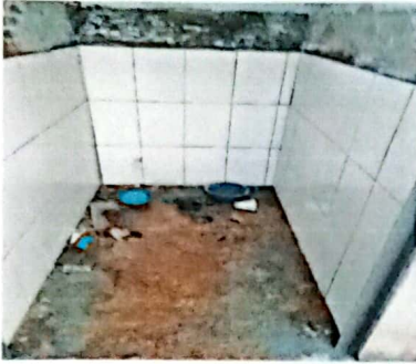
SUSTITUCION DE INODORO