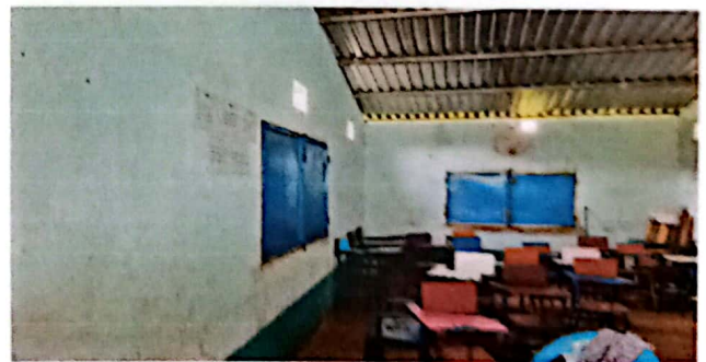
SUSTITUCION DE VENTANAS

Observación: Si es necesario se pueden agregar hojas adicionales y actualizar el número de hojas.