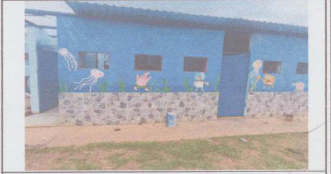
Foto 2: Mantenimiento a estructura de soporte de metal con anticorrosivo.