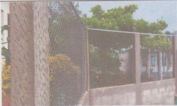
Foto 11: Sustitución de muro perimetral con tubo HG y malla galvanizada.