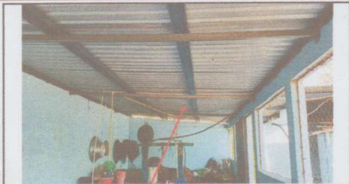
Mantenimiento de estructura de soporte (metal) por metal.