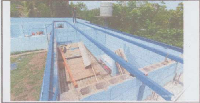
Foto1: Sustitución de lámina, por lámina troquelada Calibre 26.