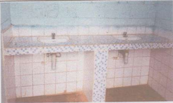
Foto 7: Sustitución de mezcladora lavamanos (llave, contra llave, tubo de abasto)