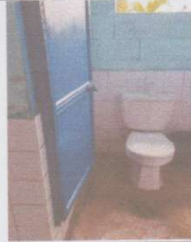
Foto 8: Sustitución de accesorios inodoro (contra llave, tubo de abasto)