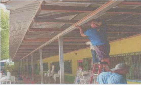
Foto1: DESMONTAJE DE MACHIMBRE ANTIGUO