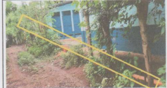
Suministro y sustitución muro perimetral de concreto

Observación: Si es necesario se pueden agregar hojas adicionales y actualizar el número de hojas.