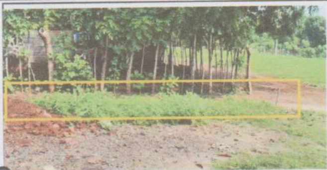
Suministro y sustitución muro perimetral de concreto