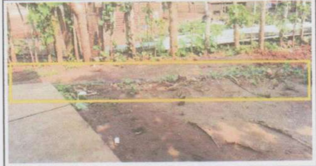
Suministro y sustitución muro perimetral de concreto