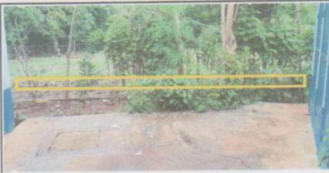
Suministro y sustitución muro perimetral de concreto