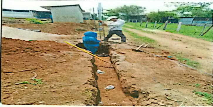
FOTO 1 SANJEADO PARA MURO