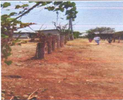
Sustitucion de muro perimetral de pared de block de concreto