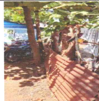
Sustitucion de muro perimetral de pared de block de concreto

Observación: Si es necesario se pueden agregar hojas adicionales y actualizar el número de hojas.