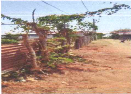
Sustitucion de muro perimetral de pared de block de concreto