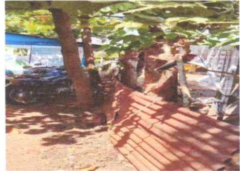
Sustitucion de muro perimetral de pared de block de concreto