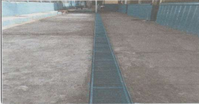
Reparación de cuneta de concreto