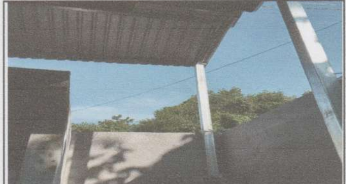
Sustitución de estructura de soporte (madera, metal) por metal.

Observación: Si es necesario se pueden agregar hojas adicionales y actualizar el número de hojas.