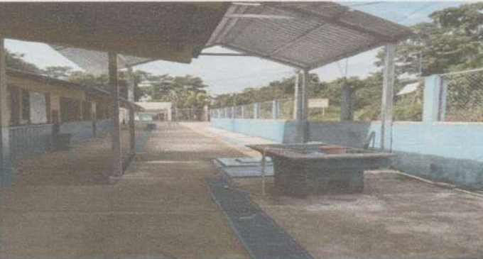
Sustitución de lámina, por lámina troquelada calibre 26 instalación de capotes de aluzinc liso de 2,20 c/u calibre 26