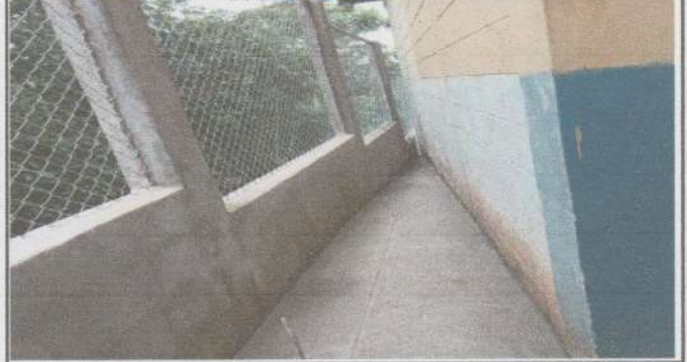
Sustitución de piso de torta de concreto