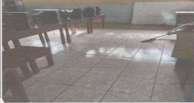
Sustitución de piso cerámico