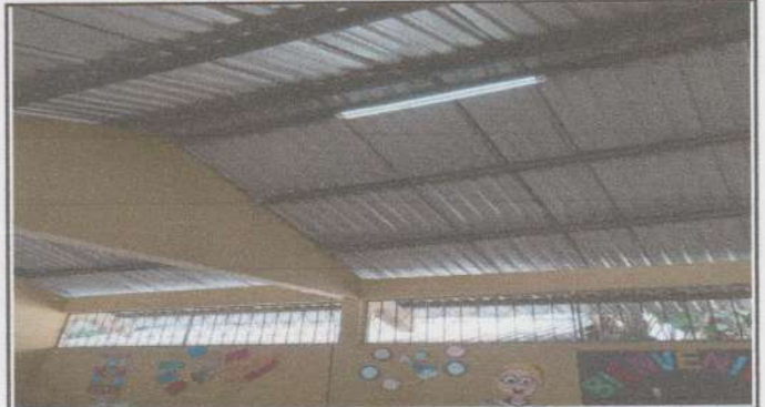
Reparación de cableado eléctrico CALIBRE 10 AWG