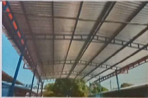
Foto 4: SUSTITUCION DE ESTRUCTURA DE SOPORTE POR ESTRUCTURA METALICA