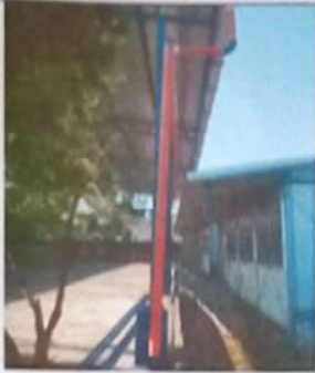
Foto1: SUSTITUCION DE BAJADA DE PVC 4"