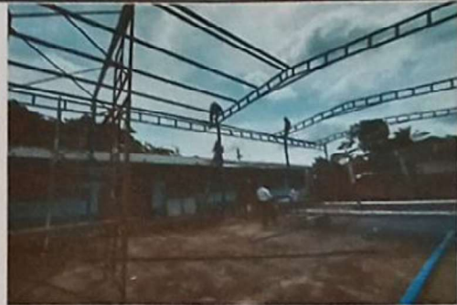
Foto 4: SUSTITUCION DE ESTRUCTURA DE SOPORTE POR ESTRUCTURA METALICA