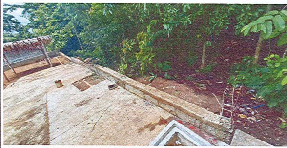
SUMINISTRO E INSTALACION DE MURO PERIMETRAL