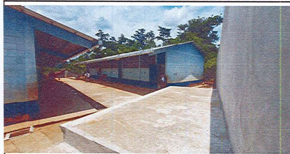
SUMINISTRO DE LAMINA TROQUELADA CALIBRE 26

Observación: Si es necesario se pueden agregar hojas adicionales y actualizar el número de hojas.