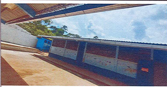
SUMINISTRO DE ESTRUCTURA PARA PATIO