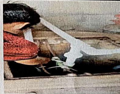
Foto 4: SUMINISTRO E INSTALACION BOMBA SUMERGIBLE 1/2 HP, TUBERIA 1" GALVANIZADA