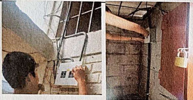
Foto 3: SUMINISTRO Y REPARACION SISTEMA ELECTRICO DE BOMBA DE AGUA Y TABLERO DE FLIPONES DE LA BOMBA