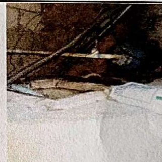
Foto 4: SUMINISTRO E INSTALACION BOMBA SUMERGIBLE 1/2 HP, TUBERIA 1" GALVANIZADA