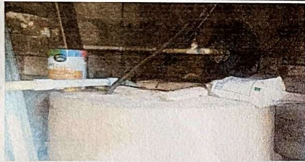
Foto 3: SUMINISTRO Y REPARACION SISTEMA ELECTRICO BOMBA DE AGUA Y TABLERO DE FLIPONES