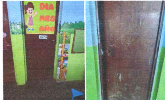
Sustitución de puertas metálicas.

Observación: Si es necesario se pueden agregar hojas adicionales y actualizar el número de hojas.