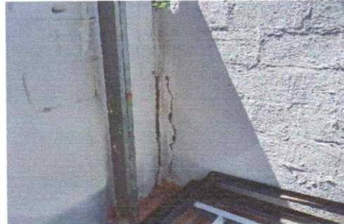
Sustitución de columnas en muro de ingreso