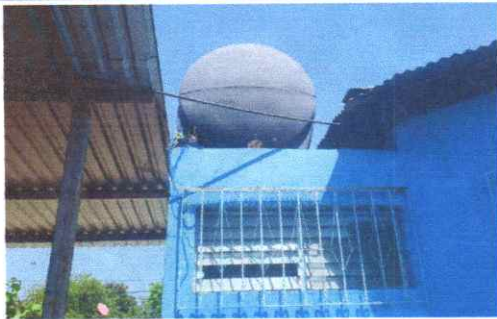
Sustitución de bomba presurizada para rotoplast