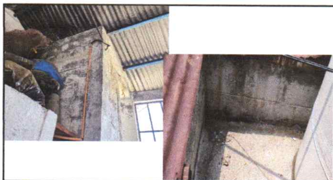
reparacion de paredes dañadas con humedad, aplicacion de impermeabilizante interior en modulo y exterior en loza modulo baños