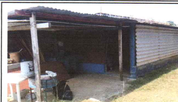
instalacion de energia electrica, iluminacion tomacorrientes en modulo de bodega y patio