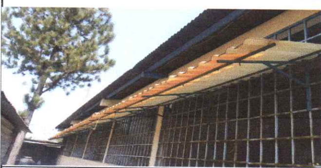
cambio de lamina traslucido de aleros en balcones de modulo de aulas.