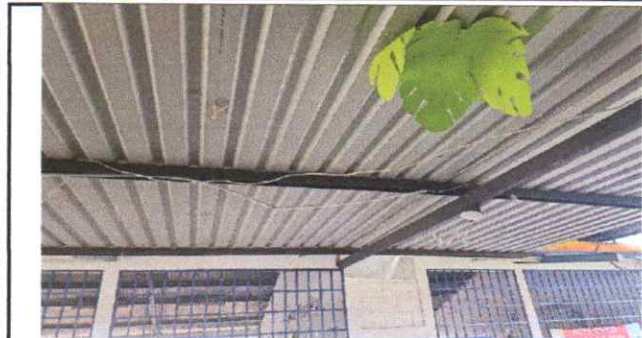
reparacion de instalacion electrica, flaponeras y colocacion de tomacorrientes