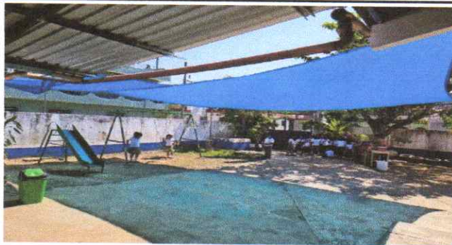
ampliacion de techado en patio frontal y colocar iluminacion