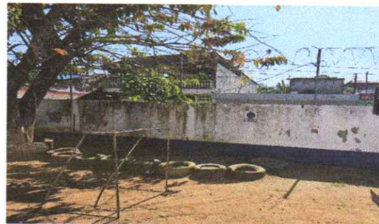
aplicación de pintura interior en muro perimetral

Revisado por: Coordinador(a) de Infraestructura Escolar