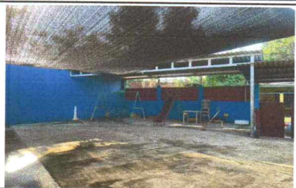
Estructura metálica para techado de patio