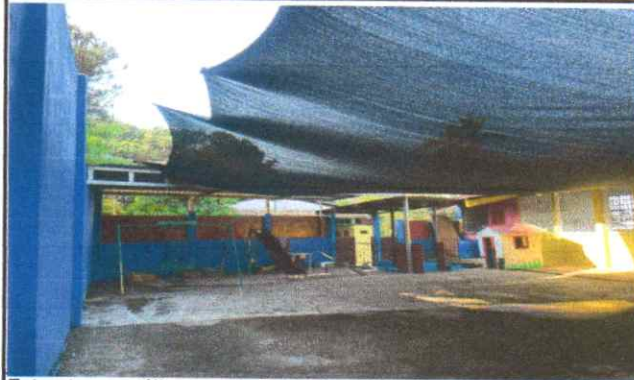
Estructura metálica para techado de patio