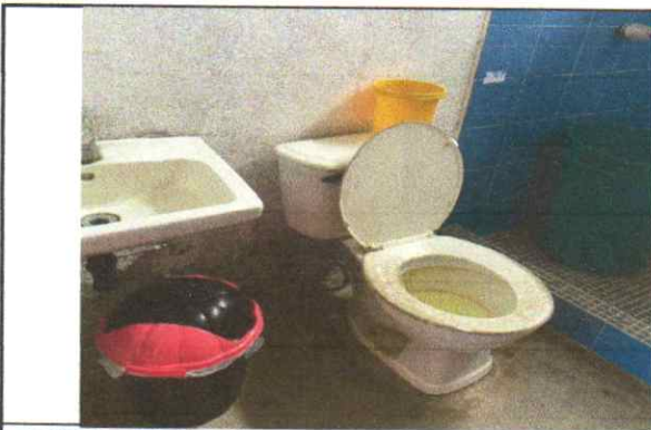
cambio de tazas de baño