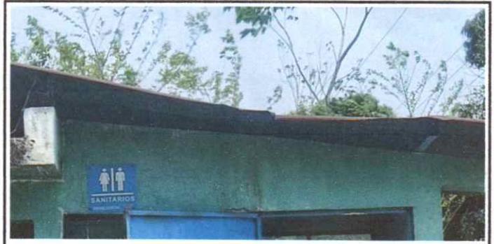
Sustitución de lamina, por lamina troquelada aluzinc calibre 26 MODULO 4 LOS BAÑOS