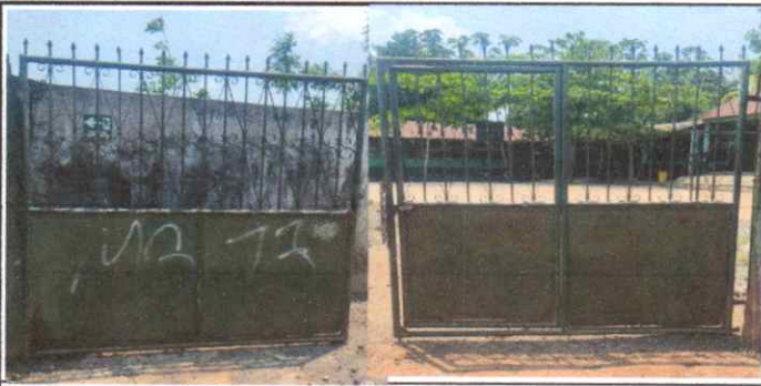
Sustitución de portón de metal