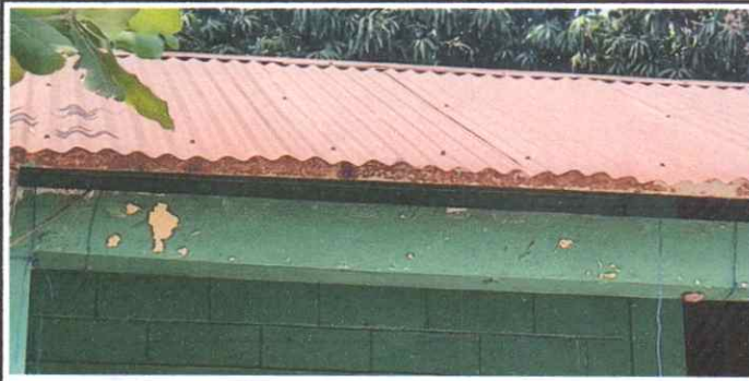
Sustitución de lamina, por lamina troquelada aluzinc calibre 26 MODULO 3