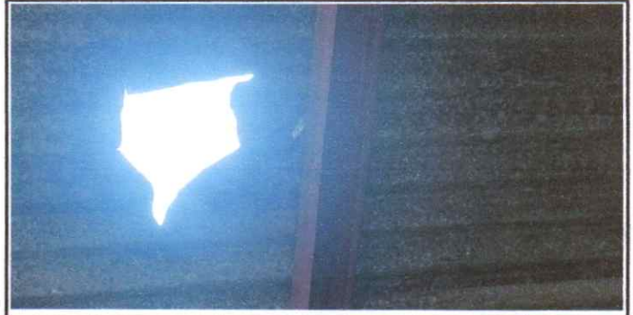
Sustitución de lamina, por lamina troquelada aluzinc calibre 26 MODULO 2