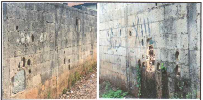
Reparación de muro perimetral de block

Observación: Si es necesario se pueden agregar hojas adicionales y actualizar el número de hojas.