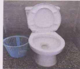
Foto 6: Suministro y sustitución de 3 inodoros con sus accesorios completos

Observación: Si es necesario se pueden agregar hojas adicionales y actualizar el número de hojas.