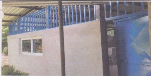
Foto 5: Suministro e instalación de 2 ventanas de PVC corredizas en aula