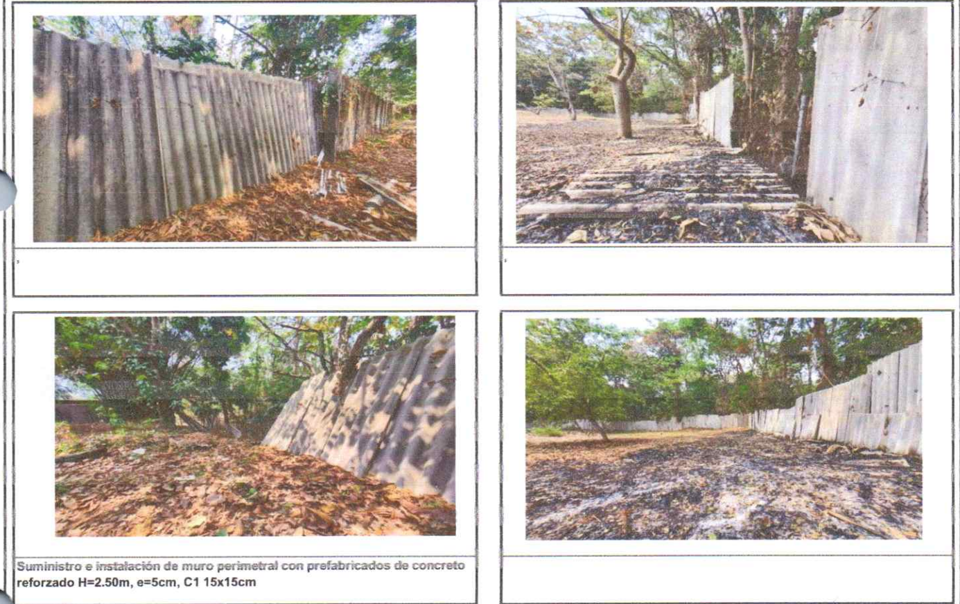
Suministro e instalación de muro perimetral con prefabricados de concreto reforzado H=2.50m, e=5cm, C1 15x15cm

Observación: Si es necesario se pueden agregar hojas adicionales y actualizar el número de hojas.