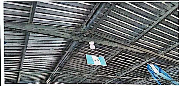
FOTO 3: sustitución de estructura de soporte de madera por metal.