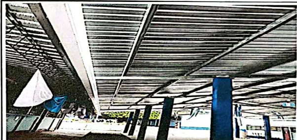
FOTO 4: sustitución de tubería PVC lineal principal agua pluviales.