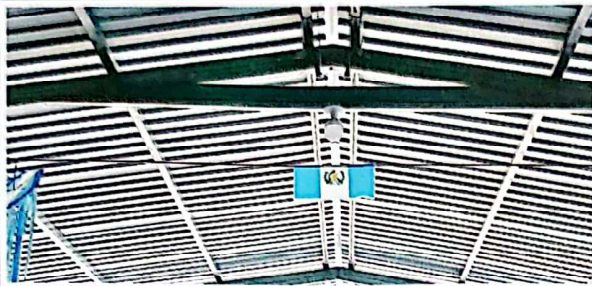
FOTO 1: sustitución de lámina por lámina troquelada calibre 26 en patio.