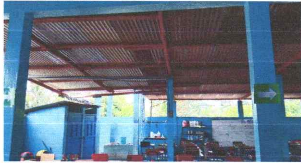
Sustitución de ducto eléctrico + accesorios.