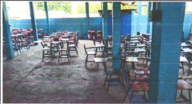
Sustitución de piso de torta de concreto.