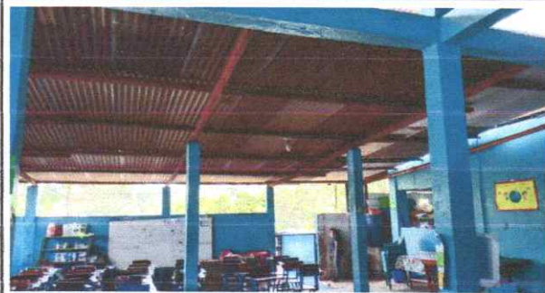
Mantenimiento a estructura de soporte de metal.