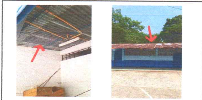
Foto 1: SUSTITUCIÓN DE COBERTURA DE LAMINA ACANALADA POR LAMINA TROQUELADA, REPARACIÓN SISTEMA ELÉCTRICO