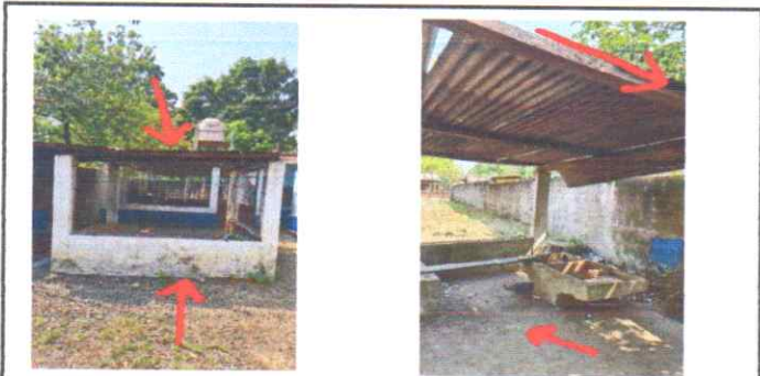
Foto 3: REPARACIÓN PARED DE COCINA, TECHO, ESTRUCTURA, GABINETES,