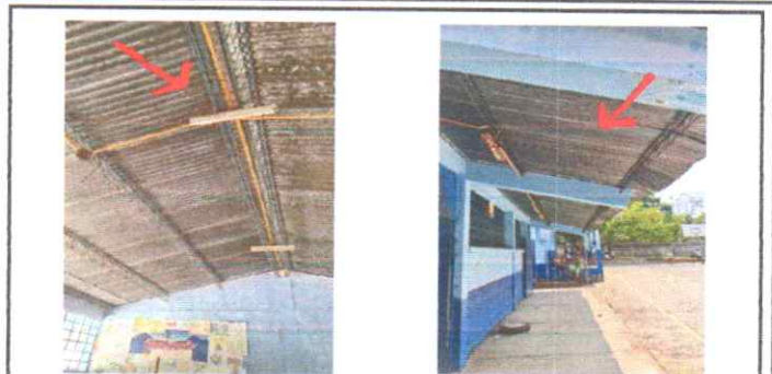
Foto 2: SUSTITUCIÓN DE ESTRUCTURA DE HIERRO POR ESTRUCTURA METÁLICA