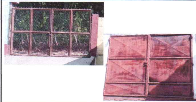
Sustitución de portones