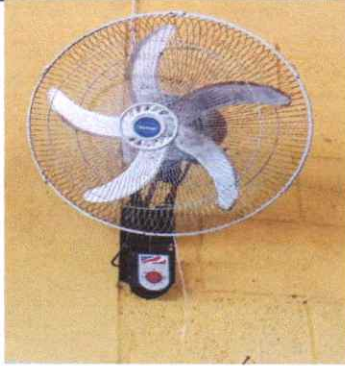
Sustitución de ventilador de pared

Observación: Si es necesario se pueden agregar hojas adicionales y actualizar el número de hojas.