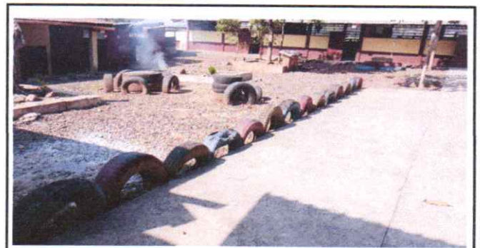
Reparación de losa de patio

Observación: Si es necesario se pueden agregar hojas adicionales y actualizar el número de hojas.