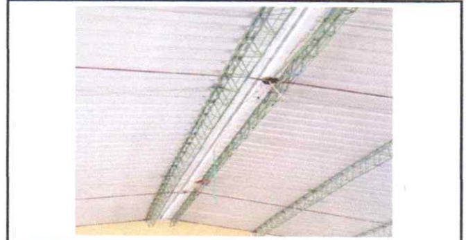
Sustitución de sistema eléctrico