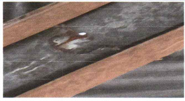
Cambio de lamina