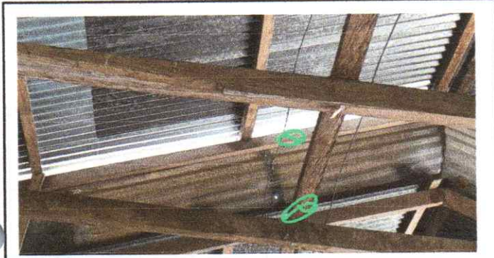
Sustitución de estructura metálica y cambio de lámina