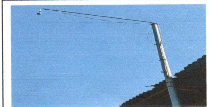
Cambio de lámpara led

Observación: Si es necesario se pueden agregar hojas adicionales y actualizar el número de hojas.