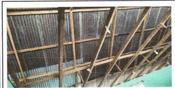
Sustitución de estructura metálica y cambio de lámina