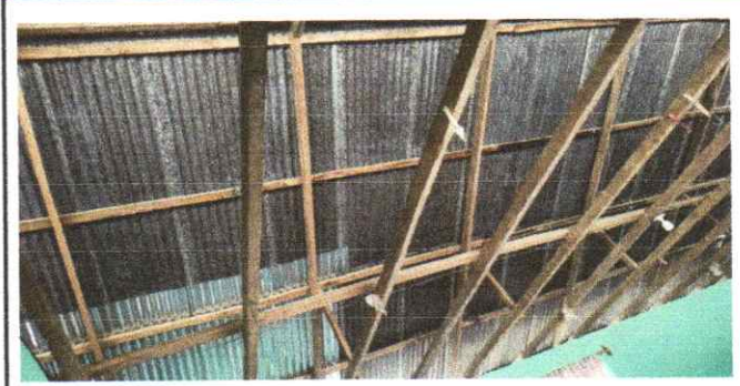
Sustitución de estructura metálica y cambio de lámina