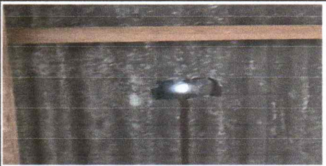
Cambio de lamina