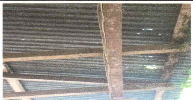
Sustitución de estructura metálica y cambio de lamina

Observación: Si es necesario se pueden agregar hojas adicionales y actualizar el número de hojas.